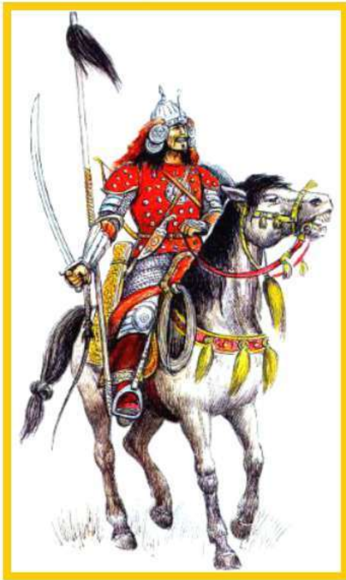
Всадник с бунчуком.

История флагов уходит корнями в 9 век до н.э. Тогда впервые в армиях стали использовать специальные шести с пучками травы, или конскими волосами, переплетенными в пучок.