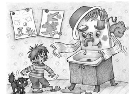
Пример демонстрационного материала из комплекта карточек «Что такое хорошо и что такое плохо».

III. Организационный раздел раскрывает: 1) основные подходы к организации образовательной деятельности в дошкольной образовательной организации; 2) рекомендации по адаптации парциальной программы «Мир Без Опасности» к запросу особого ребенка; 3) особенности взаимодействия педагогического коллектива с семьями воспитанников; 4) примерный перечень материалов и оборудования для создания развивающей предметно-пространственной среды; 5) список учебно-методических и наглядно-дидактических пособий, рекомендуемых для успешной реализации парциальной образовательной программы «Мир Без Опасности».