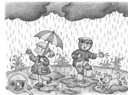
Пример демонстрационного материала из комплекта карточек «Опасные явления в природе» (см. Приложение 1).

В связи с вышесказанным, возникает необходимость четкого выделения целевых ориентиров, задач и содержания образования , направленного на формирование культуры безопасности личности, начиная с