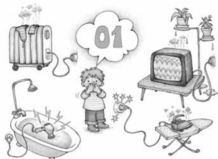
Пример демонстрационного материала из комплекта карточек «Пожарная безопасность» (см. Приложение 1).

Парциальная образовательная программа «Мир Без Опасности» разработана в соответствии с требованиями Федерального государственного образовательного стандарта дошкольного образования (Приказ Минобрнауки России № 1155 от 17.10.2013) и согласована с Федеральным законом «Об обра-