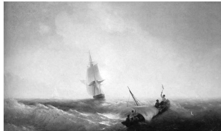
Айвазовский И. Спасаящиеся от кораблекрушения. 1844.

Кораблю безопасней в порту, но он не для этого строился. Грейс Хоппер