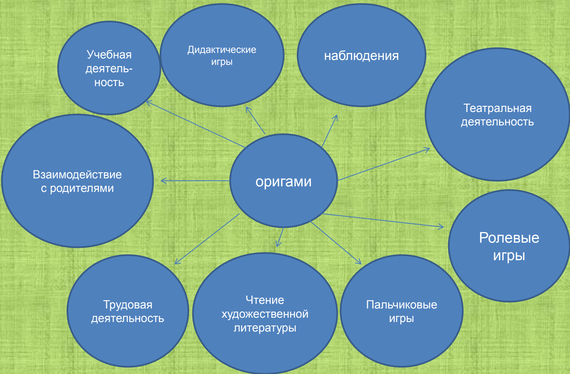
Схема реализации занятий оригами через разные виды деятельности.